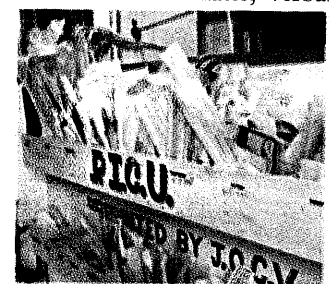
Wichtiger Vorrat: Spritzenmaterial für die Kinderklinik.